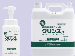
500mL 5L (コック添付)

殺菌消毒薬用石ケン液 医薬部外品 グリンズ® α 泡タイプ イソプロピルメチルフェノール0.3w/v%