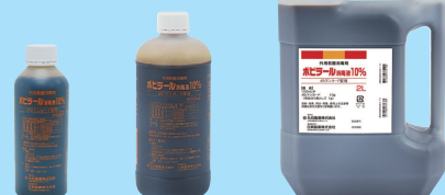
250mL 500mL 2L(コック添付)

外用殺菌消毒剤 薬価基準収載 ポビドンヨード製剤 ポビラール® 消毒液 10% 100mL中 日局ポビドンヨード10g (有効ヨウ素として1g)