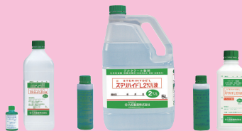
2w/v%液: 1L 2w/v%液: 5L 20w/v%液: 500mL

化学的滅菌・殺菌消毒剤(医療用器具・機器・装置専用) グルタール製剤 劇薬 薬価基準未収載 ステリハイド® L2w/v%液・20w/v%液 2w/v%液: 1L中 グルタール40g(グルタルアルデヒドとして20g) 20w/v%液: 1L中 グルタール400g(グルタルアルデヒドとして200g)