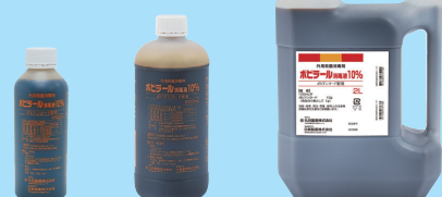
250mL 500mL 2L（コック添付）

外用殺菌消毒剤 薬価基準収載 ポビドンヨード製剤 ポビラール® 消毒液 10% 100mL中 日局ポビドンヨード10g （有効ヨウ素として1g）