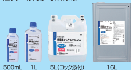
500mL 1L 5L(コック添付) 16L