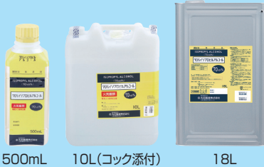
500mL 10L(コック添付) 18L