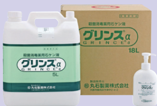
300mL、5L（コック添付）、18L（コック添付）

殺菌消毒薬用石ケン液 医薬部外品 グリンズ® α イソプロピルメチルフェノール0.3w/v%