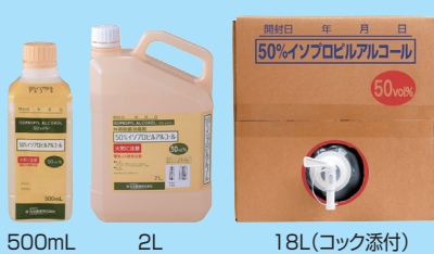
500mL 2L 18L(コック添付)