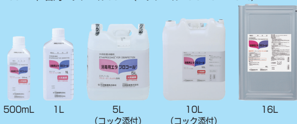
500mL 1L 5L(コック添付) 10L(コック添付) 16L