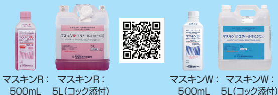
マスキンR： マスキンR： マスキンW： マスキンW： 500mL 5L(コック添付) 500mL 5L(コック添付)